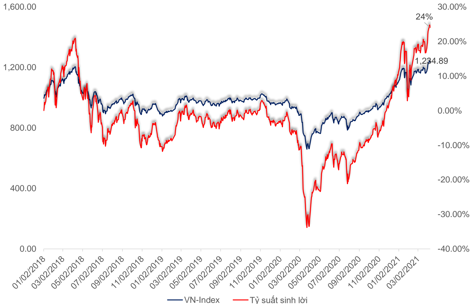
Diễn biến tỷ suất sinh lời năm 2021